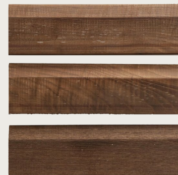
Cepillo para madera